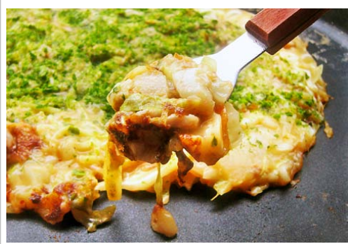
エバラ食品工業株式会社レシピ参照